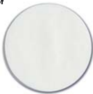
1. kirkas, sileä lasi