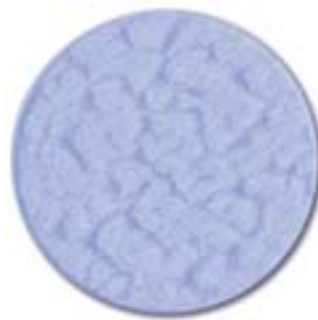
5. sininen lasi

Lasi kiinnitetään lyhtykeyhseen ruuvi kiinnitteisesti, jolloin tarvittaessa lasi on helposti vaihdettavissa.