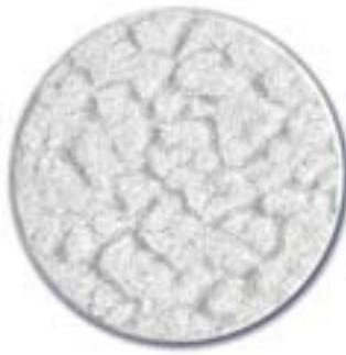
2. kirkas kuviolasi