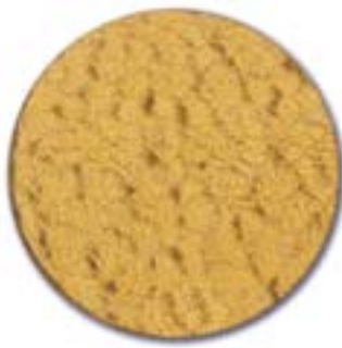
4. pronssinsävyinen kuviolasi