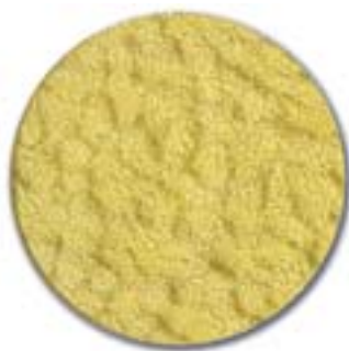
3. keltainen kuviolasi